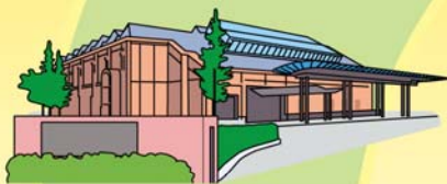
トヨタテクノミュージアム 産業技術記念館